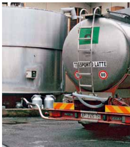
I picchi di contaminazione da aflatoxine si verificano in autunno-inverno

La variazione stagionale del contenuto in aflatoxina M1 nel latte, di cui si riporta l'evoluzione nei tre anni di sperimentazione ( grafico 1 ), è stata studiata su alcuni centri di raccolta piemontesi (monitorati dal 2005 al 2007).