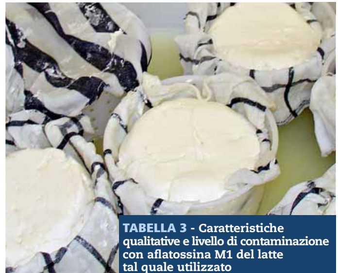
TABELLA 3 - Caratteristiche qualitative e livello di contaminazione con aflatoxina M1 del latte tal quale utilizzato per le due caseificazioni